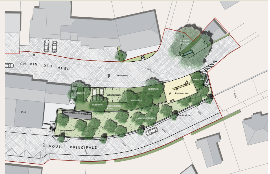
SITUATION AUSSICHTSPLATTFORM - ZIERKIRSCHENHAIN MST 1:250