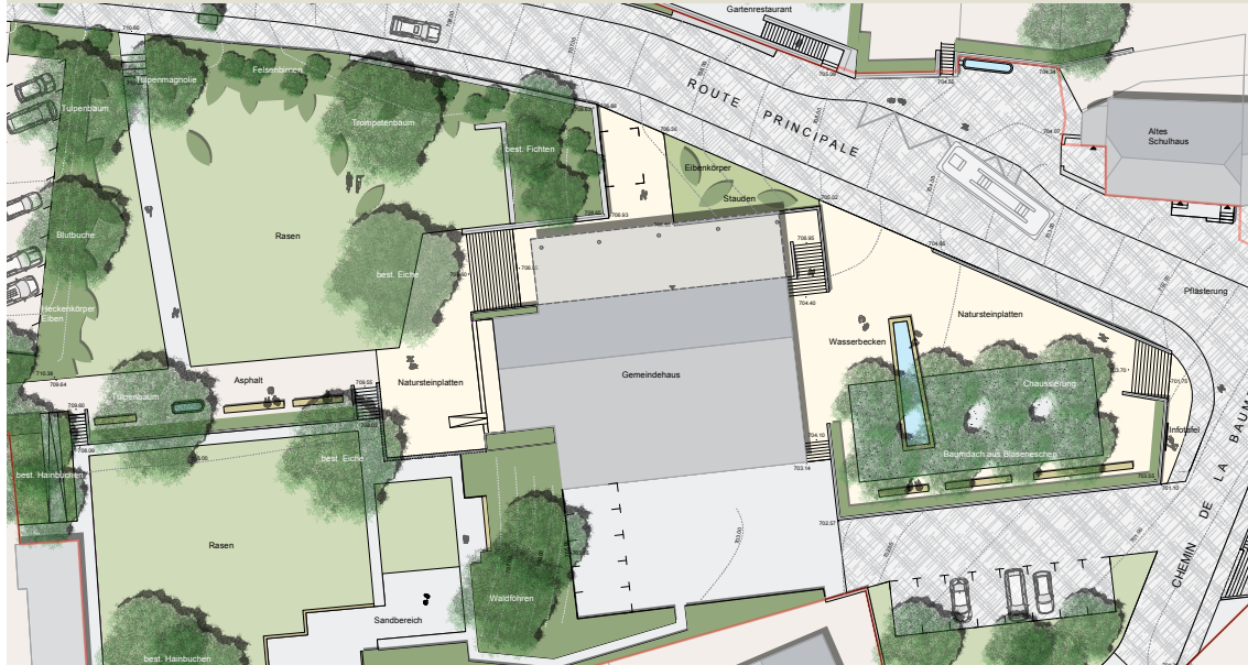
SITUATION PARK - PLACE DE LA MAIRIE MST 1:250